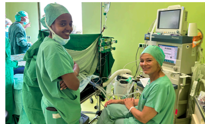
Bei der OP im IOCCA