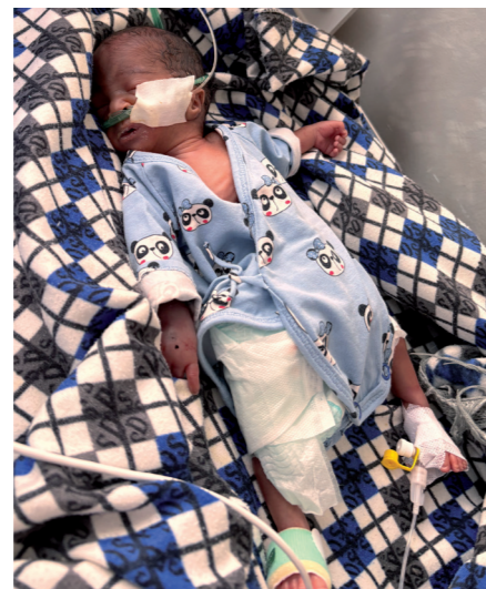
Frühchen, geboren in der 28. Schwangerschaftswoche

Mit der Sanierung der Geburtshilfe und der Verbesserung der medizinischen Ausstattung schafft das Projekt Mendefera die Grundlage für eine nachhaltige Geburtshilfe und Neonatologie in der Region Debub. Jede Investition in Räume, Technik und Wissen wirkt doppelt – für Personal und Patient:innen, für Sicherheit und Zukunft – und stärkt dauerhaft die Versorgungsqualität der gesamten Region.