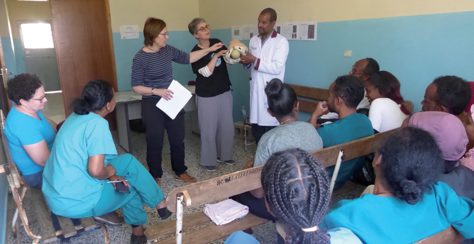
Geburtshilfliche Schulung mit den Kolleg:innen in Mendefera