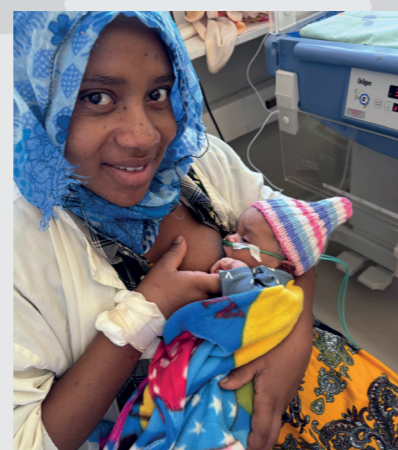
Glückliche Mama nach einer schwierigen Geburt mit ihrer gesunden Tochter